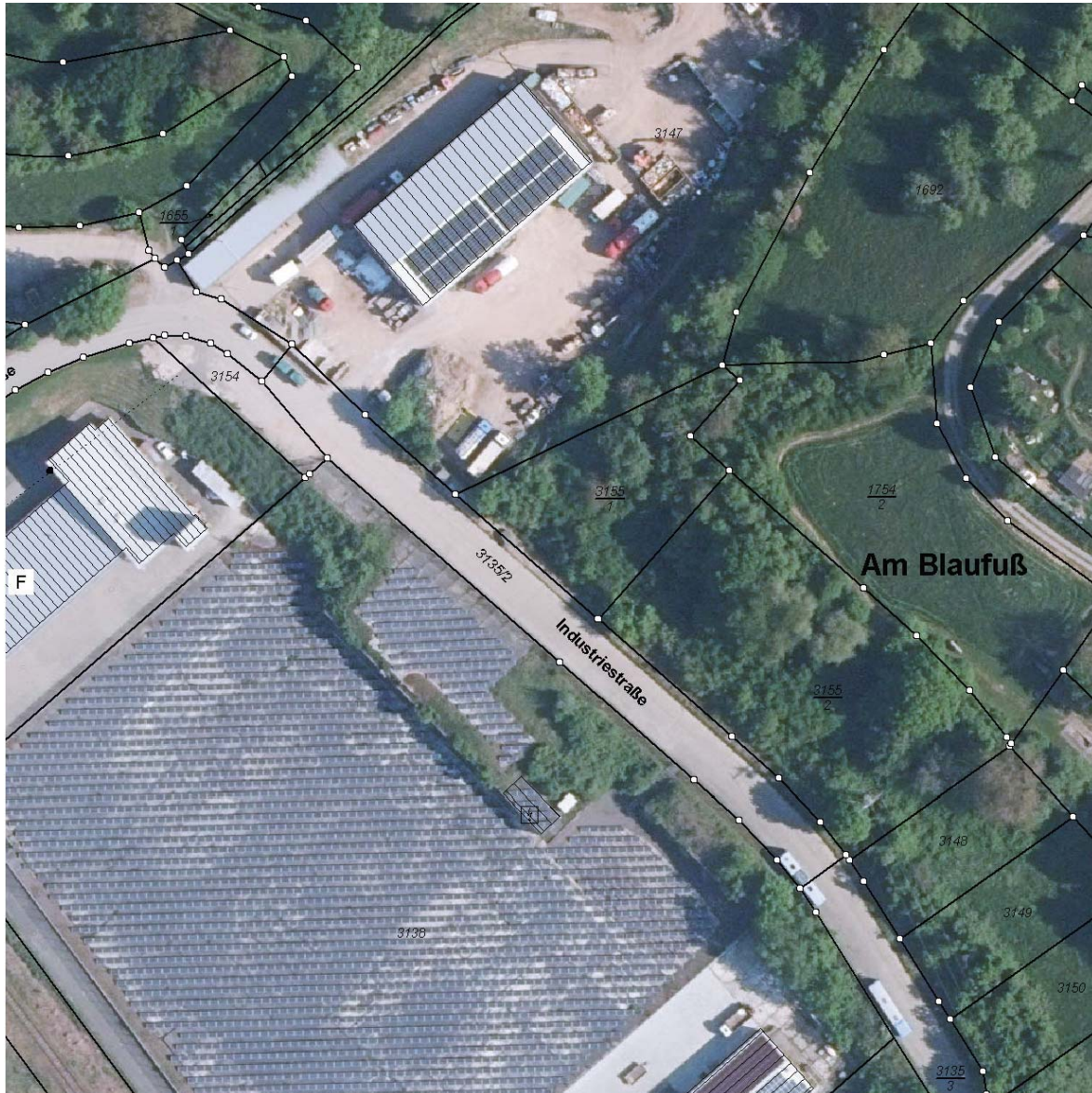
Luftbildauschnitt mit aktuellem Kataster

Die Ortsgemeinde Altenglan plant die 2. vereinfachte Teiländerung des Bebauungsplanes „Gewerbegebiet Brühl - Neufassung“. Die Änderung betrifft das bisher als Verkehrsfläche festgesetzte Flurstück 3135/2. Die Verkehrsfläche wird dem Gewerbegebiet mit der Plan-signatur D zugeschlagen. Neben der Begründung für die Änderung bleibt die Begründung für das bestehende Plangebiet weiterhin gültig.