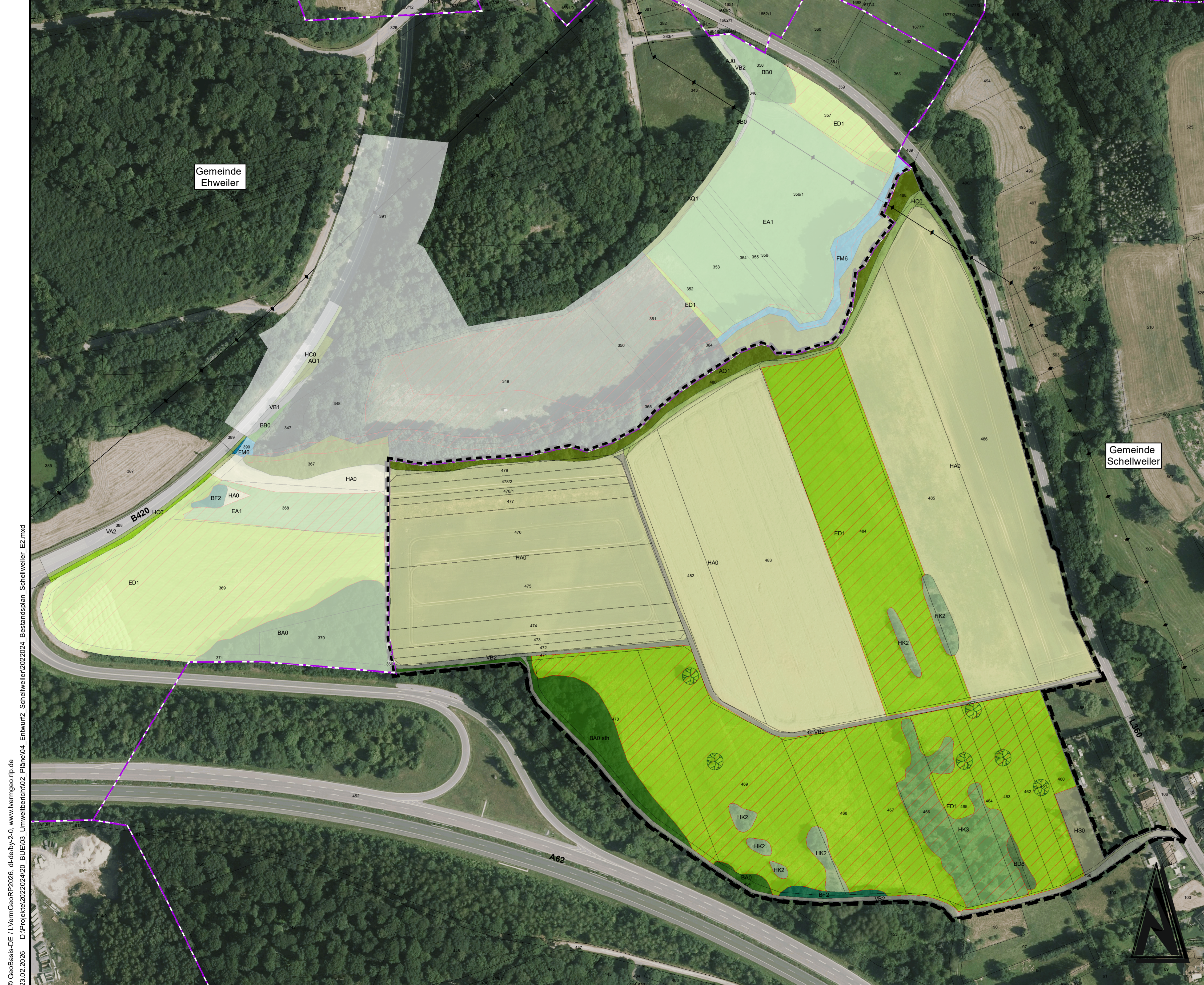
Ausgleichsmaßnahmen E2, M. 1:2.000 (Gemeinde Schellweiler: Flurstück 510, 525, 526, 528, 529, 530, 531, 591)